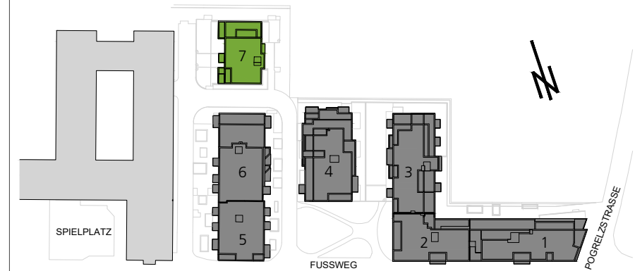
ORIENTIERUNGSPLAN STIEGEN 1-7